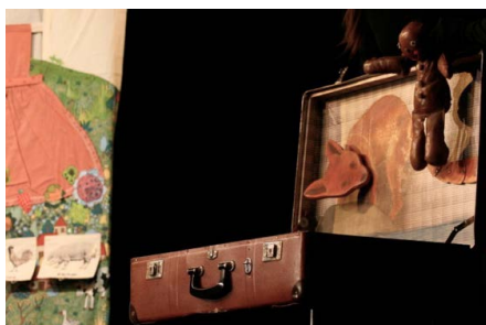
Les Malices du Bonhomme de pain d'épice, la rencontre avec le renard.