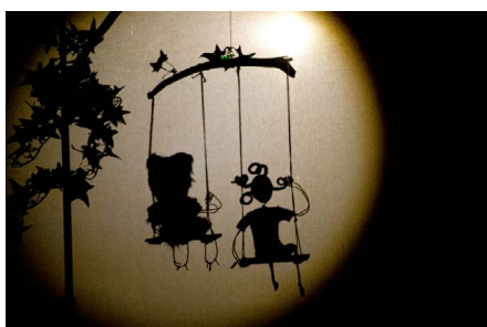
Boucle d'or, une étrange affaire, la rencontre avec Petit Ours, en ombres.

Une équipe rassemblée autour de l'envie de fabriquer des spectacles pour le jeune public. Des spectacles qui voyagent entre le théâtre et le conte. Sur le plateau, les scènes se fabriquent à vue, les objets, les dessins deviennent des personnages, des marionnettes. On affirme avec la scénographie et le texte, être au théâtre, pour justement enlever le quatrième mur et pour embarquer le public dans l'histoire. Les spectacles sont toujours conçus pour que tout se replie dans deux (grosses) valises. Nous jouons dans des lieux non équipés, aussi bien que dans des plus grandes salles et des festivals. La petite forme est un choix. Cette « légèreté du décor » permet de créer des temps particuliers avec le public. Comme en Russie (tournée organisée par l'Alliance Française) où nous avons voyagé en transsibérien jusqu'à Vladivostok et fait dix étapes pour jouer devant des enfants russes apprenant le français. Comme en Guadeloupe, où, pour rencontrer des enfants qui ont peu la possibilité d'aller jusque dans les théâtres, nous prenons bateaux et petits avions pour rejoindre des îles moins fréquentées.