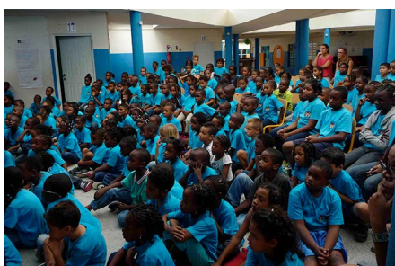
Les spectateurs devant La Naissance du Carnaval, à Saint-Martin.