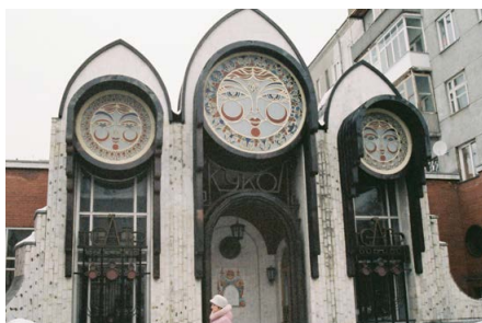
Le Théâtre de Marionnettes de Novosibirsk, pendant la tournée en Russie.